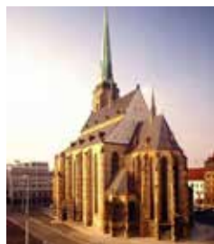
Gotická katedrála sv. Bartoloměje v Plzni – nejvyšší kostelní věž v Čechách (102,6 m)