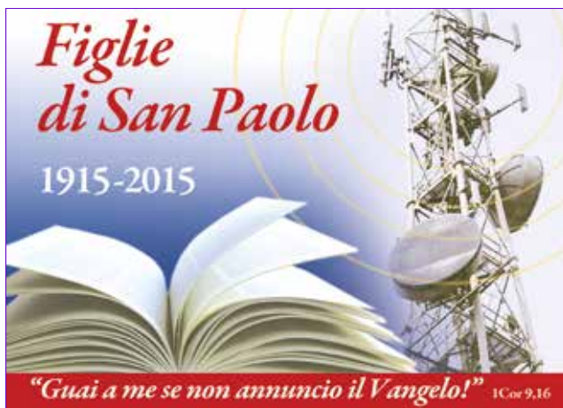
Na obrázku grafický návrh poštovní známky, která v Itálii vyšla při příležitosti stoletého jubilea Dcer sv. Pavla.