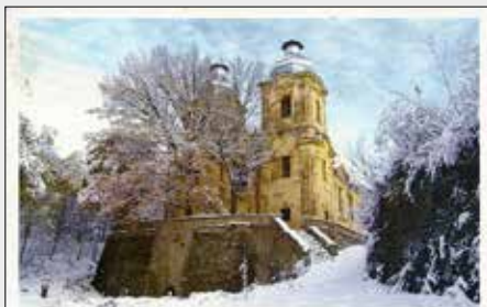
Skoky u Žlutic / Maria Stock