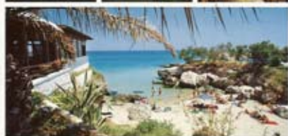
Perle di Puglia