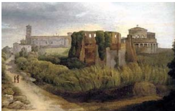
Na obrázku je kostel Sant' Agnese na římské Via Nomentana, jak ho zobrazil středověký italský malíř.

Důsledkem této volby vzdoropapeže Benedikta X. bylo přijetí nových norem, týkajících se budoucího výběru nového papeže. Podle nich byli z volby vyloučeni jakkoli laikové a roz-