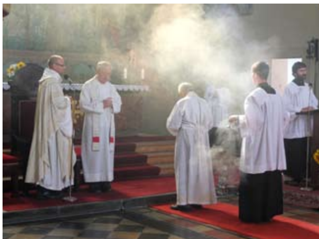
Pout' u Sv. Anny 2015