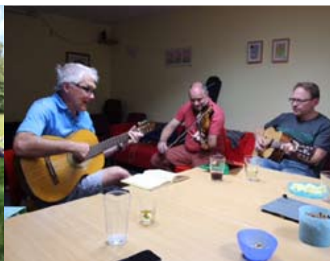
večery při hudbě a povídání