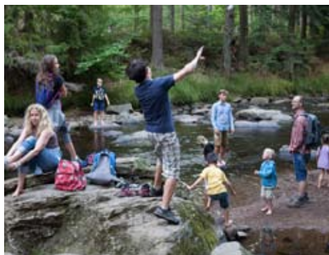
společné výlety do okolí