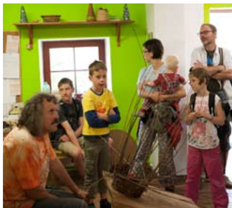
navštěva chráněných dílen v Bartošovicích