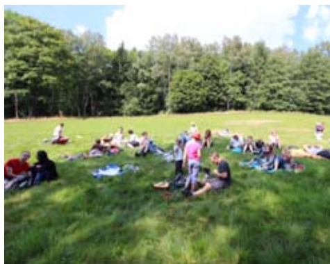
společný závěrečný piknik v Neratově