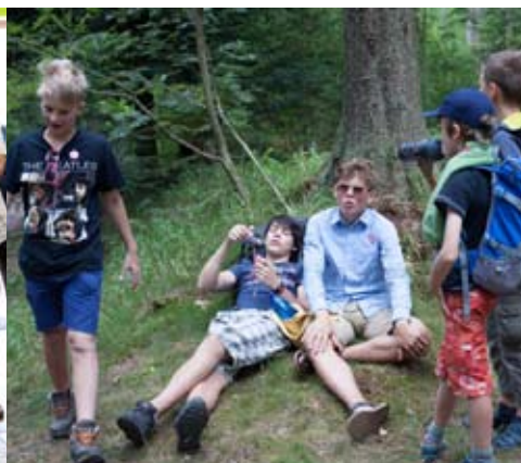
společné výlety do okolí