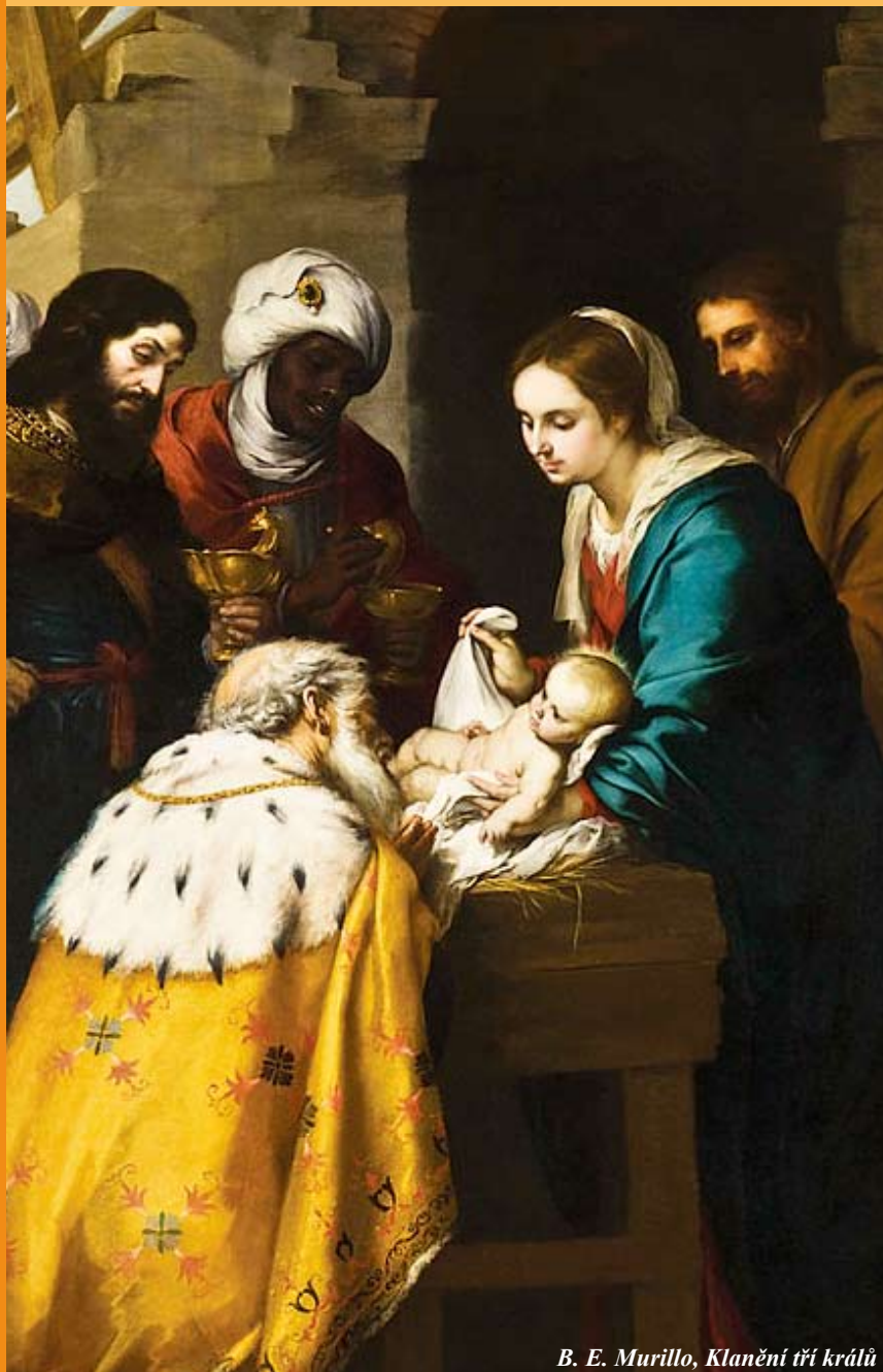
B. E. Murillo, Klanění tří králů