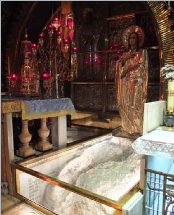
Chrám Božího hrobu, Golgota