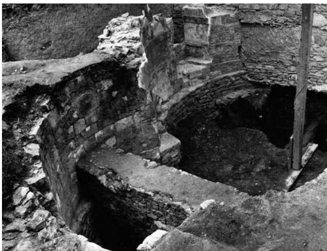
Odkryté základy a nadzemní zdivo jižní strany rotundy s vchodem. Pohled od severovýchodu. Foto V. Kvapil, 1987. Zdroj: http://www.praha-archeologica.cz

Provedení rotundy bylo velmi pečlivé, jednotlivé opukové kvádríky tvořící interiérový líc byly dokonce opracovány do oblouku, aby vznikl dokonalý kruh. Vstup do rotundy vedl z jižní stra-