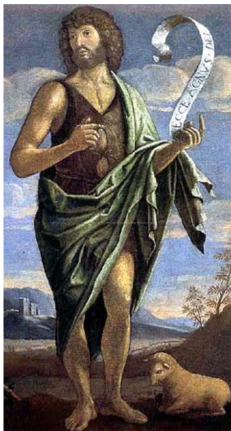
Bartolomeo Veneto, Jan Křtitel