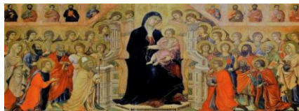
obraz sienského dómu Maria Vládkyně

Zjevení plačící Panny Marie Francie 1846