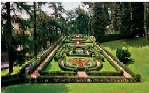
zahrady letního sídla

Castel Gandolfo je malé italské město ležící asi 30 km jihovýchodně od Říma na břehu jezera Albani. Město je světově proslulé tím, že se v něm nachází papežovo letní sídlo. Papežové si kraj Castelli Romani oblíbili už od prvních dob renesance.