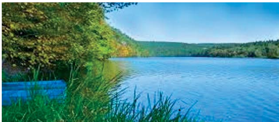
Jižní Čechy - soutok Vltavy s Lužnicí