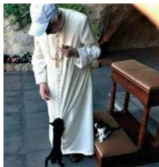
Benedikt XVI. s kočkami

V areálu nechybějí ani portréty všech papežů: vyniká obraz Františka — je zachycen ve velmi prostém bílém hávu s jednoduchou černou obuví. Návštěvníci mohou navštívit i přilehlý park a pěstěnou zahradu s fontánami, odkud je nádherný výhled na jezero Albano. To měří 55 hektarů. Uvidí i malou farmu, z níž každé ráno vyjíždí dodávka s čerstvou zeleninou, vejci i sýry do kuchyně Domu svatě Marty ve Vatikánu. Papež Jan Pavel II. tu nechal zřít i úly a malou vinici.