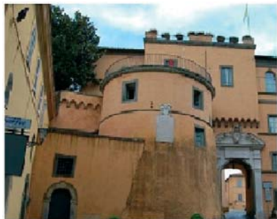
papežský letní palác