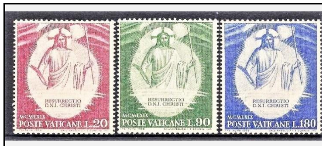
VATIKÁNSKÉ POŠTOVNÍ ZNÁMKY S TĚMATEM ZMRTVÝCHVSTÁNÍ (1969)