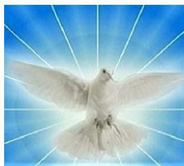
HOLUBICE - SYMBOL DUCHA SVATÉHO

Zdá se, že nynější přítomnost stojí proti nám, a proto se nám často vysmívají, tupí nás a pronásledují, protože v očích světa platíme za hlupáky. My ale stavíme svůj život na Kristu a sloužíme Mu. Nevkládáme svou naději na slabé lidi, ale na Božího Syna, který nás vykoupil svou smrtí a zmrtvýchvstáním. Triumf Kristův v poslední den bude také naším triumfem. Na konci času stojíme my křesťané na straně vítěze.