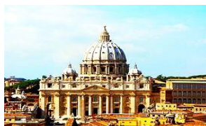
Řím – basilika sv. Petra