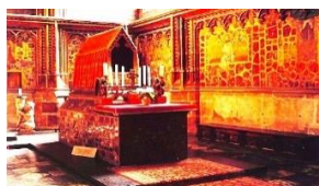
pražská katedrála – Svatováclavská kaple

V sobotu 7. 10. 2023 se koná farní pout', tentokrát do katedrály k našim národním světcům. Srdečně zvu všechny farníky, a zvláště všechny rodiny. Chceme prosit za požehnání a ochranu zvláště pro rodiny z naší farnosti a nová kněžská a duchovní povolání. Sejdeme se před R.M.A. centrem Dukelských hrdinů č. 17 Praha 7 blízko tramvajové zastávky Strossmayerova nám. (pod kostelem sv. Klimenta) ve 12.45 a odtud půjdeme pěšky na Pražský hrad do katedrály cca 50 min. velmi pozvolnou chůzí a příjemným prostředím. Kdo by nemohl jít s námi pěšky, může přijít rovnou na mši sv. do katedrály – ve 14:00 ve Svatováclavské kapli, které bude následovat výklad k historii a významu Svatováclavské kaple od našeho farníka Mgr. Tomáše Havelky, PhD. Následně si bude možné ještě projít katedrálu a zastavit se u hrobů našich národních patronů, sv. Vojtěcha, Víta, Jana Nepomuckého. Zakončení počítám cca kolem 16.00 orientačně. Těším se na společně strávený čas v modlitbě. P. Vít Uher, farář.