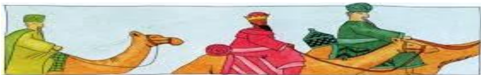
Putovali na svých velbloudech...

Kdyby byl totiž tento nový člověk, jenž vzal na sebe tělo, jako mají hříšní lidé, ne-vzal na sebe našeho starého člověka, a maje stejnou podstatu s Otcem se neuvolil přijmout i stejnou podstatu s matkou, kdyby se byl nespojil – sám bez hříchu – s naší přirozeností, veškeré lidské pokolení by stále setrvalo v zajetí ďáblovy moci. Také bychom nemohli mít účast na jeho slavném vítězství, kdyby bylo vybojováno bez účasti naší přirozenosti. Z tohoto podivuhodného účastenství nám zazářila svátost znovuzrození. Skrze téhož Ducha, skrze něhož byl počat a zrozen Kristus, rodíme se tedy duchovně i my. Proto říká evangelista o věřících, že se zrodili ne z krve, ani z vůle těla, ani z vůle muže, ale z Boha .