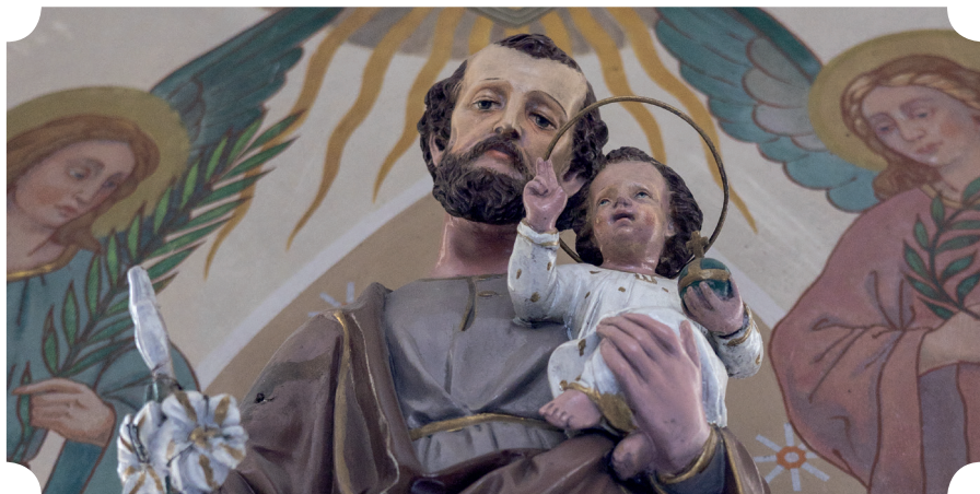
Socha sv. Josefa s Ježíšem v kostele sv. Anny